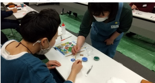
▼釉薬を載せている様子