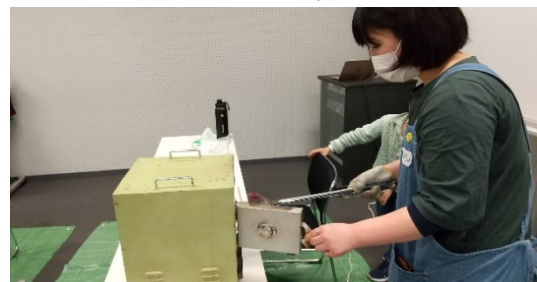
▼焼成している様子