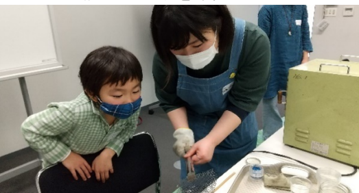
▼焼き上がりを確認